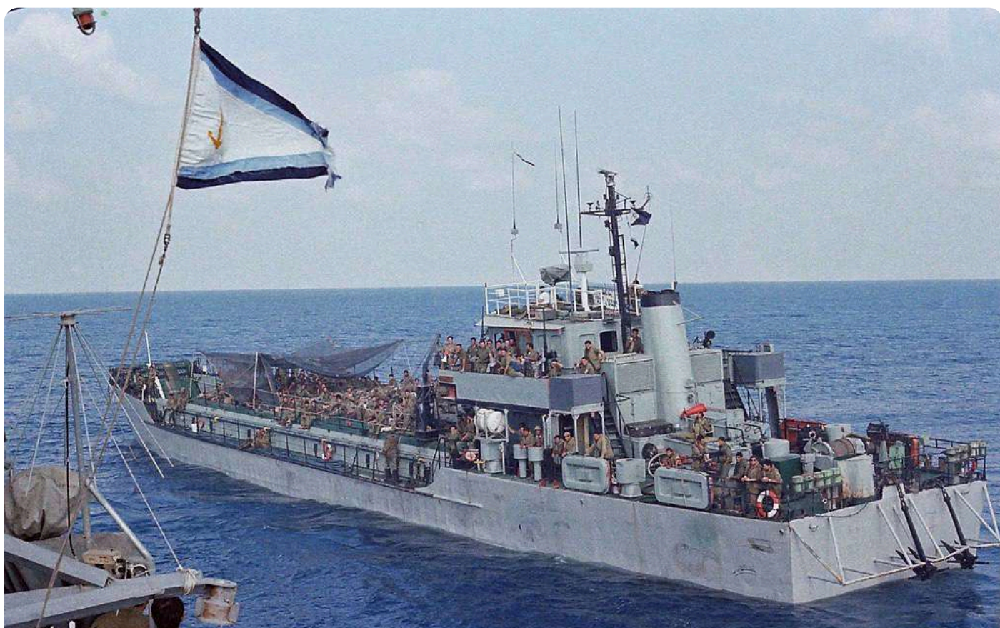
הנחתת פ-61 נושאת רכב קרבי וחיל הגלים בשיט לנחיתה הראשונה בלבנון