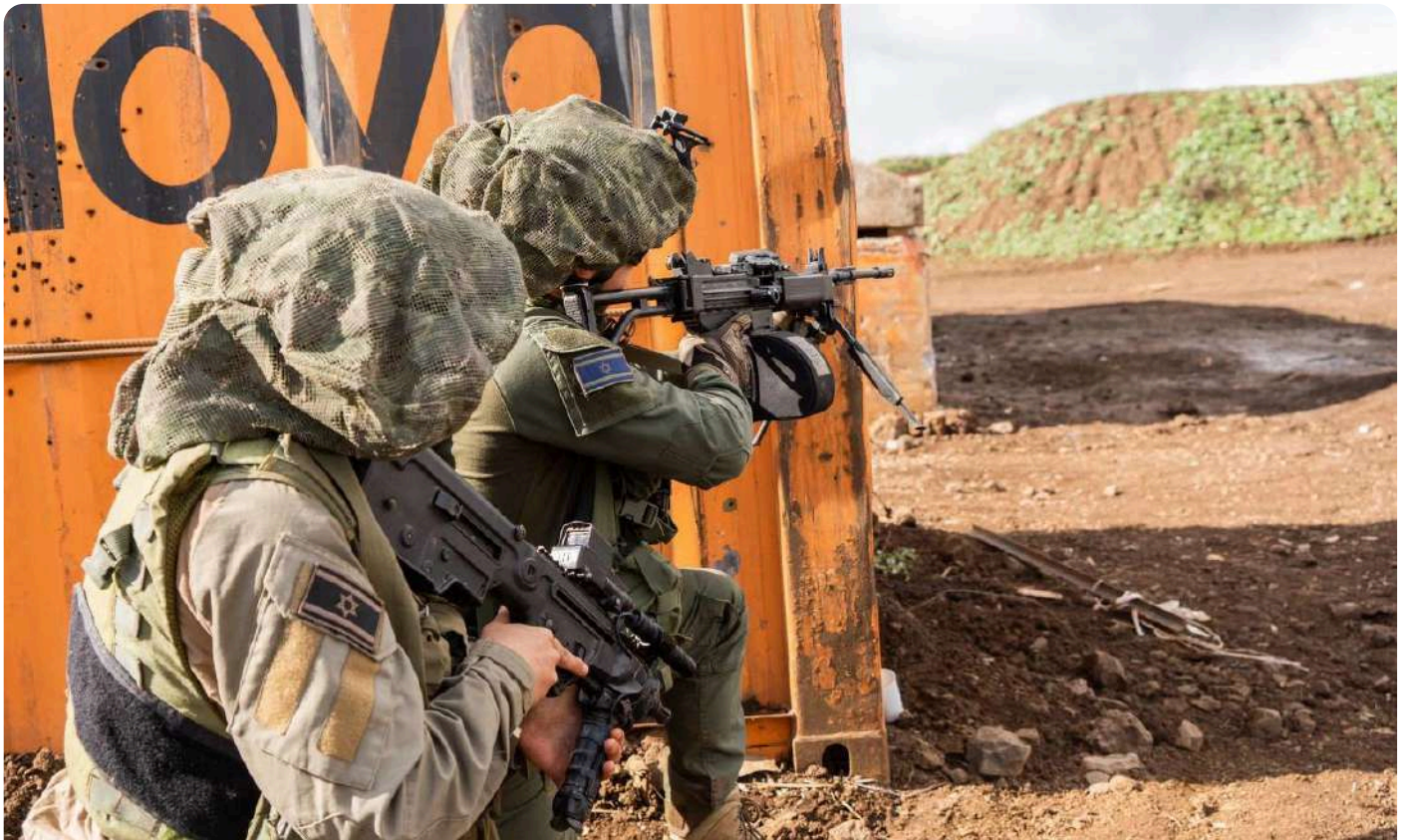
לוחמי צה"ל במהלך "חרבות ברזל".

כך היה תמיד. בקרב האחרון לפני בירות; בקרבות במערכות שצה"ל לחם בהם מאז; במלחמת "חרבות ברזל" ברצועת עזה. רוח הלחימה היא גם הסיבה שגדוד 697, יום לאחר שספג הרוגים ופצועים בבית חאנון ב־10 בנובמבר 2023, התאושש כעוף החול, יצא להתקפה, הרג פעילי חמאס והמשיך לעמוד במשימותיו. אין לרוח הלחימה תחליף וכמו תיבת נוח בונים אותה לפני המבול, באימונים עצימים ומדמי מלחמה של המסגרות (פלוגה, גדוד ומעלה), בין שבתרגילים רב־חיליים ורב־זרועיים (תרגילי אוגדה והתרגיל בקפריסין ביוני 2022 למשל), טיפוח וחינוך המפקדים ליוזמה והתקפיות, חיכוך מלמד ביחידות סדירות, ערבי גיבוש למפקדים והעמקות בנושאי תו"ל, מורשת והיסטוריה ועוד.