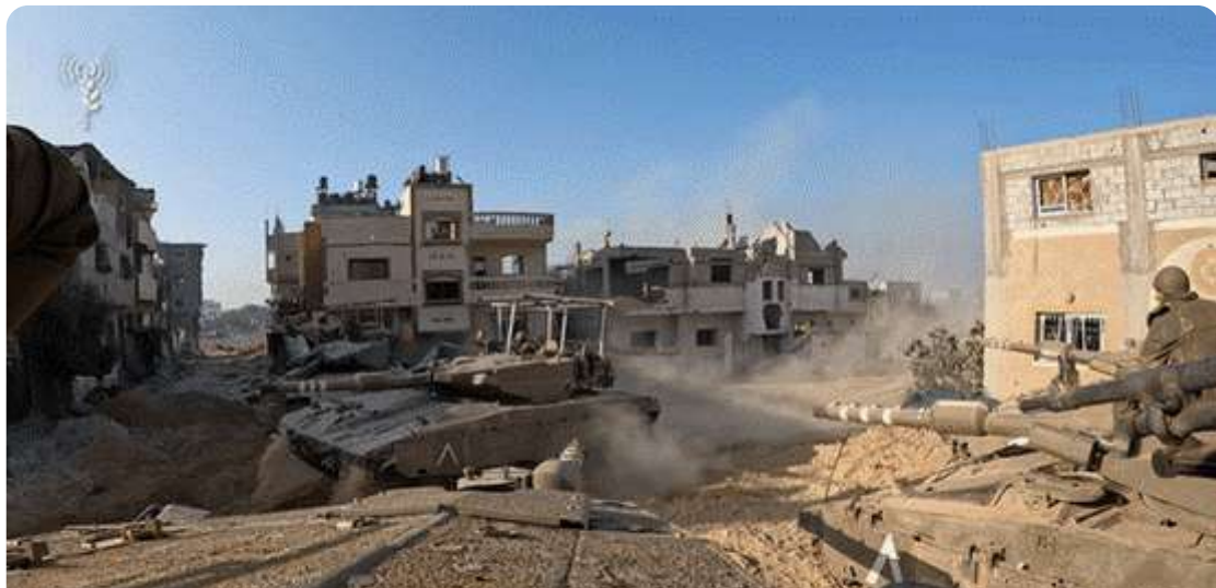
פעילות חטיבה 551 בבית חאנון, נובמבר 2023.

עד לאחרונה תמרנו כוחות צה"ל ברצועת עזה. בה בעת צריך להתכונן למלחמה בצפון, אם תבוא. הספר אתי מלבנון יצא לאור לפני למעלה משלושה עשורים, אך את עיקר הלקחים ממנו – קרקע, עצמאות הכוחות, פיקוד משימה (ופיקוד מלפנים) ותחבולה – אפשר לקחת למלחמה ברצועת עזה כדי להצליח במלחמה בלבנון